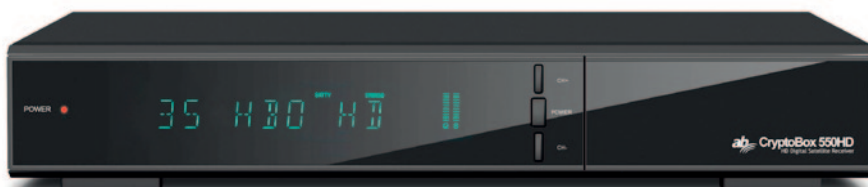
AB CryptoBox 550 s elegantným dizajnom a jasne viditeľným displejom

A zaberie aj hodinu, kým si z tejto voľby vyselektujete to pravé. Ani pri voľbe FastScan to, samozrejme, nie je úplne bez práce, lebo veľa závisí od možnosti, akú máte predplatenú ponuku u poskytovateľa, ale je to výrazná pomoc. Konštatujeme, že pomocou sprievodcov zvládne nastavenie prijímača každý.