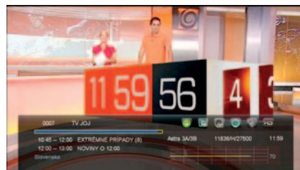
Pri prepínaní máte k dispozícii aj informačné okno, zobrazujúce napr. aj kvalitu signálu